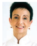
CARME RUSCALLEDA CUINA ESTUDI Espagne