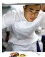
ANDRE CHIANG REST. SICHUAN MONN Chine