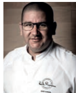
DANI GARCIA Rest. DANI GARCIA Espagne