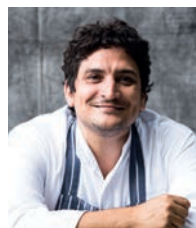
MAURO COLAGRECO MIRAZUR France