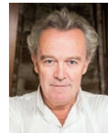
ALAIN PASSARD L'ARPEGE France