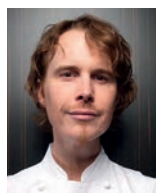
GRANT ACHATZ ALINEA USA