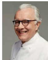
ALAIN DUCASSE PLAZA ATHENEE France