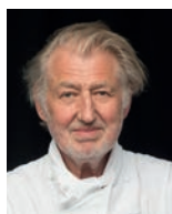
PIERRE GAGNAIRE Rest. PIERRE GAGNAIRE France