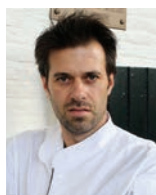
SERGIO HERMAN THE JANE Belgique