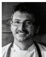
ANDONI LUIS ADURIZ MUGARITZ Espagne