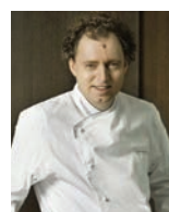
SVEN ELVERFELD AQUA Allemagne