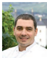
CHRISTIAN BAU VICTOR'S FINE DINING Allemagne