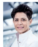
DOMINIQUE CRENN ATELIER CRENN USA