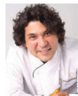
GASTON ACURIO ASTRID & GASTON Pérou