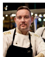
ALBERT ADRIA TICKETS Espagne