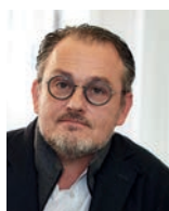
BRUNO OGER VILLA ARCHANGE France