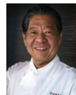
YOSHIHIRO MURATA KIKUNOI Japon