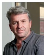
EDOUARD LOUBET REST. EDOUARD LOUBET - France