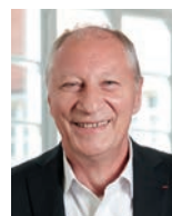
ERIC FRECHON EPICURE France