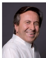
DANIEL BOULUD Rest. DANIEL USA