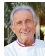
MICHEL GUERARD LES PRES D'EUGENIE France