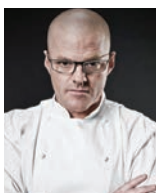
HESTON BLUMENTHAL THE FAT DUCK Royaume-Uni