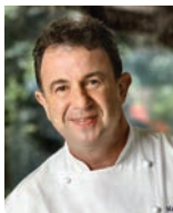
MARTIN BERASATEGUI REST. MARTIN BERASATEGUI Espagne