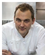
DANIEL HUMM ELEVEN MADISON PARK USA