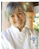
NADIA SANTINI DAL PESCATORE Italie