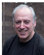
VICTOR ARGUINONIZ ASADOR ETXEBARRI Espagne