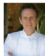
THOMAS KELLER PER SE USA