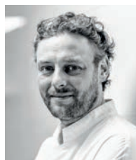
ARNAUD DONCKELE LA VAGUE D'OR France