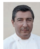
JOAN ROCA EL CELLER DE CAN ROCA Espagne