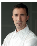
ENEKO ATXA AZURMENDI Espagne