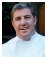
CLAUDE BOSI BIBENDUM Royaume-Uni