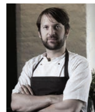
RENE REDZEPI NOMA Danemark