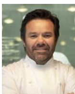
MICHEL TROISGROS Maison TROISGROS France