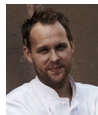
BJÖRN FRANTZEN REST. FRANTZEN Suède