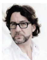
QUIQUE DACOSTA REST. QUIQUE DACOSTA Espagne